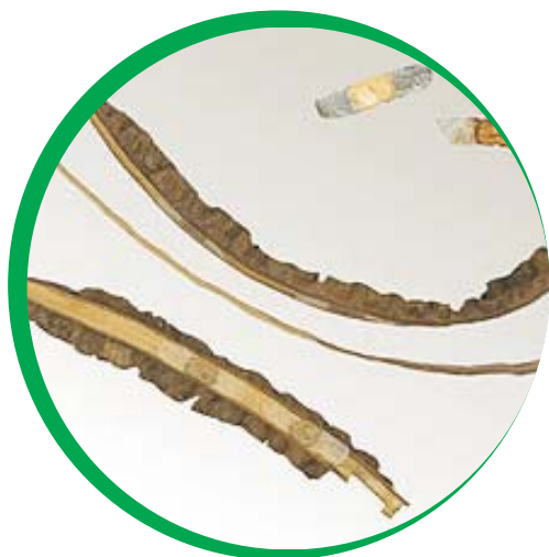
Fruto e sementes