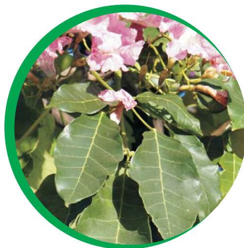
Folhas e flor