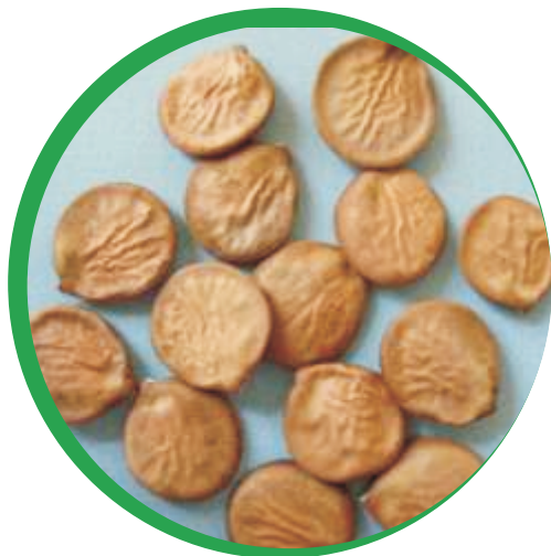
Fruto e sementes