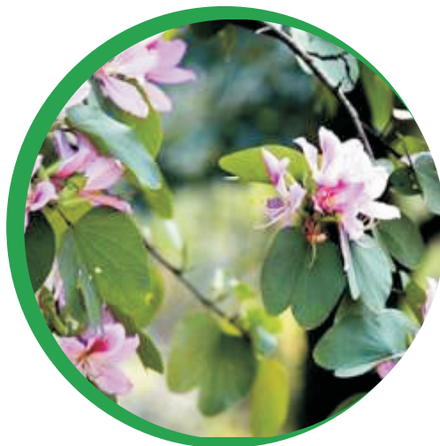
Folhas e flor