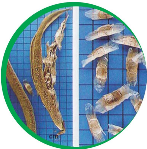
Fruto e sementes