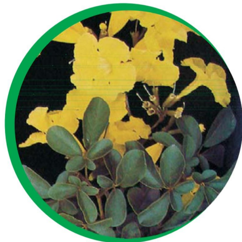
Folhas e flor