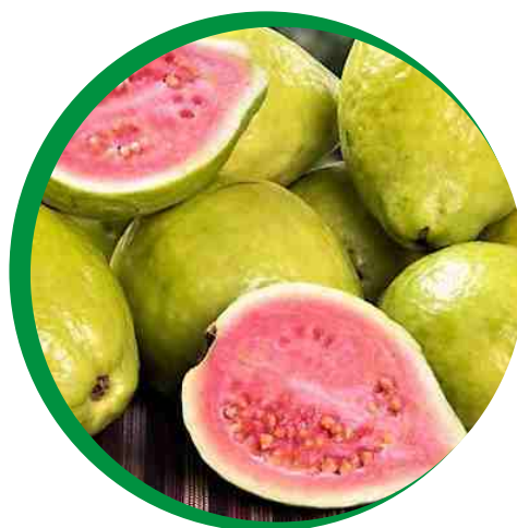
Frutos e sementes