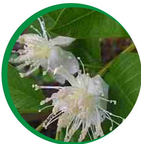
Folhas e flores